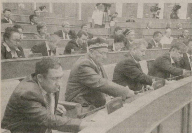
Содик САФОЕВ, председатель Комитета Сената по внешнеполитическим вопросам:

В рамках повестки дня сенаторы рассмотрели вопросы об отчете председателя правления Центрального банка Республики Узбекистан о деятельности Центрального банка Республики Узбекистан в 2010 году.