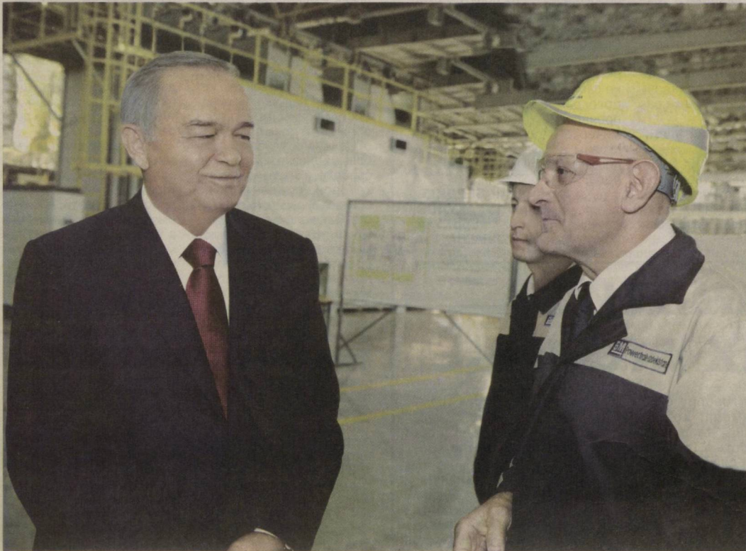
На снимке: Президент Республики Узбекистан Ислам Каримов с работниками совместного предприятия «General Motors Powertrain Uzbekistan».

Президент Ислам Каримов 28 августа ознакомился с осуществленной работой на новом совместном предприятии по производству автомобильных двигателей и новом аэровокзале местных линий в Ташкенте