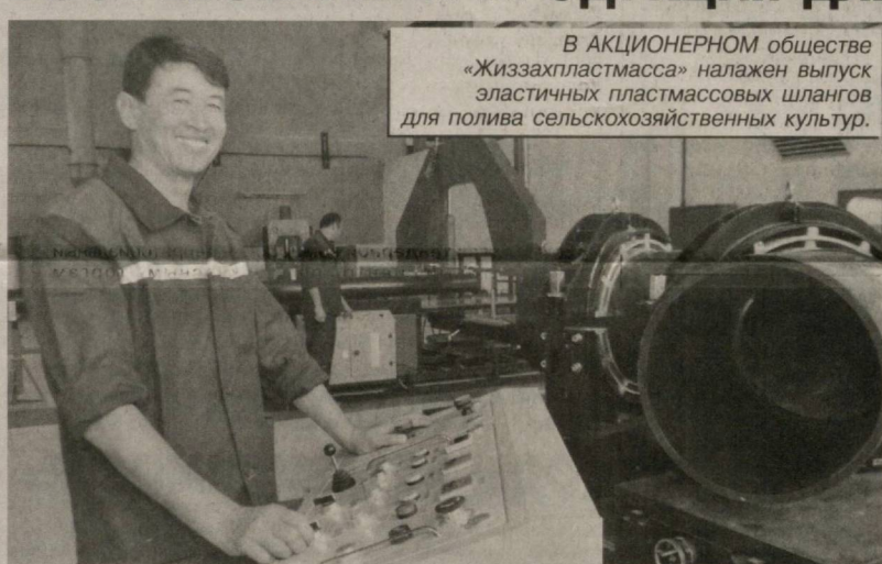
В АКЦИОНЕРНОМ обществе «Жиззахпластмасса» налажен выпуск эластичных пластмассовых шлангов для полива сельскохозяйственных культур.