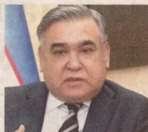
Алишер АЪЗАМҲУЖАЕВ, Ўзбекистон Республикасининг Туркия Республикасидаги Фавқулодда ва муҳтор элчиси

Президентимиз Шавкат Мирзиёев раҳнамолигида Ўзбекистон ташқи сиёсатида катта ўзгаришлар ва ислохотлар амалга оширилмоқда. Давлатимиз раҳбарининг мамлакатимиз ҳаётини чуқур билиши, халқимизнинг халқаро алоқалардаги устувор манфаатларини тўғри баҳолай олиш қобилияти ва салоҳияти ташқи сиёсатимизда янги уфқларни очиб берди.