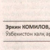
Эркин КОМИЛОВ, Ўзбекистон халқ артисти:

Бошқа йирик тиллар ичида ўз мавқеини йўқотиб, бой бериб қўймаслиги учун озоод мамлакатнинг ҳар бир фуқароси ўз она тилининг раванқи йўлида тинимсиз қурашмоғи лозим. Бу курашни, айниқса, ҳозирги ва келаятган замонларда бир зум ҳам сусайтириб бўлмайди. Тил тараққиётига давлат, миллат, халқнинг ўзи ҳам ҳеч қачон лоқайд муносабатда бўлмаслиги керак.