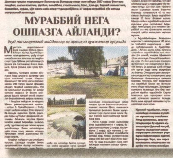
Мураббий нега ошпазга айланди?

Газетанинг шу йил 24 сентябрдаги сонидан чоп этилган «Мураббий нега ошпазга айланди?» сарлавхали мақолага Жисмоний тарбия ва спорт вазирлиги қуйидагича муносабат билдирди: