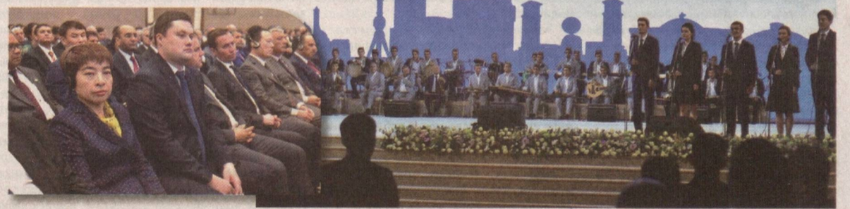
Президент Шавкат Мирзиёевнинг ўзбек тилига давлат тили мақоми берилганининг ўттиз йиллигига бағишланган тантанали маросимдаги нутқини тинглаб...

21-ОКТАБР O'ZBEK TILIGA DAVLAT TILI MAQOMI BERILGAN KUN