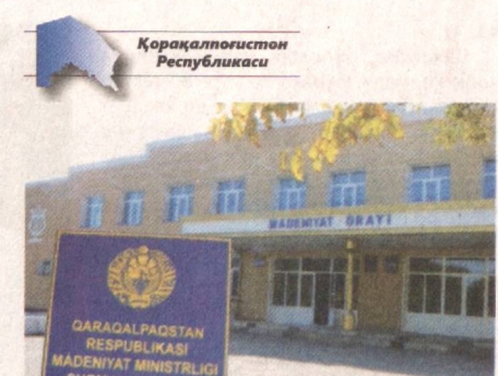
Қорақалпоғистон Республикаси Оғриқ тишлар...

Пайсалга солмай, ишга киришинг. Нима, синфдошларини муал-