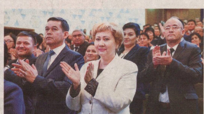
Олий Мажлиси Олий Мажлиси

кич 12,1 триллион сўмга етгани ҳам фикримизни тасдиқлайди. Шунингдек, дори воситалари ва тиббий буюмлар ҳамда тиббиёт объектиларини қуриш-таъмирлаш ишларига ажратилаётган маблағлар миқдори 3 баробар ортди. Мамлакатимизда профилактик тиббиётни ривожлантиришга эътибор тобора кучаймоқда. Айни пайтда халқимизга бу йўналишда 1793 амбулатория-поликлиника муассасаси, жумладан, 817 қишлоқ врачлик пункти, 798 қишлоқ оилавий поликлиникаси, 178 шаҳар оилавий поликлиникаси хизмат кўрсатмоқда. Тиббиётнинг бирламчи тизимини мақбуллаштириш ишлари натижасида қишлоқ оилавий поликлиникаларида аёллар маслаҳатхоналари, қизлар саломатлиги хоналари, тез ёрдам шохобчалари ва ижтимоий дорихоналари, 5 та тор соҳа мутахассислари фаолияти йўлга қўйилди. Аҳоли энг кўп муурожаат қиладиган соҳа – шошилинч ва тез ёрдам хизмати фаолияти ҳам кейинги йилларда янги босқичга кўтарилмоқда. Тез ёрдамнинг махсус санитар автотранспорт паркни янгилади. Тизимда икки ярим мингга яқин «Nissan», «Honda», «Toyota» русумли ва бошқа замонавий тез ёрдам машиналари аҳолига хизмат кўрсатмоқда. Янги харид қилинган 281 реанимобиль зарур асбоб-ускуналар билан тўлиқ жиҳозланди. 2019 йилда