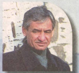
Муҳаммад ЮСУФ, Ўзбекистон халқ шоири

Шундай ўрғат қулни, хонни, Учмас қуш ҳам учар бўлсин. То байроқдан олдин жонни Бермоқ осон кечар бўлсин.