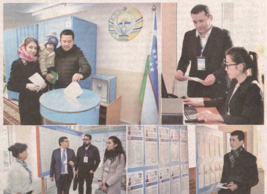
2019 йил 22 декабрь куни мамлакатимизда муҳим ижтимоий-сиёсий тадбир – Ўзбекистон Республикаси Олий Мажлиси Қонунчилик палатаси ва халқ депутатлари маҳаллий Кенгашларига сайловлар бўлиб ўтди. Бу галги тадбирлар «Янги Ўзбекистон – янги сайловлар» шиори остида ўтказилди.