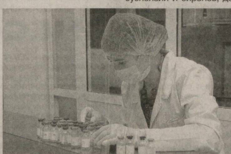
лабораторией, соответствующий международным стандартам. К концу 2012 года

Фармацевтическое производство, на котором создано 50 новых рабочих мест, оснащено новейшим оборудованием по выпуску различных видов лекарственных препаратов. Компания «NOVA PHARM» приступила в областном центре к реализации данного проекта сметной стоимостью в восемь миллионов долларов в 2008 году. В настоящее время здесь завершены первый этап строительных работ. В частности, возведен современный производственный комплекс с