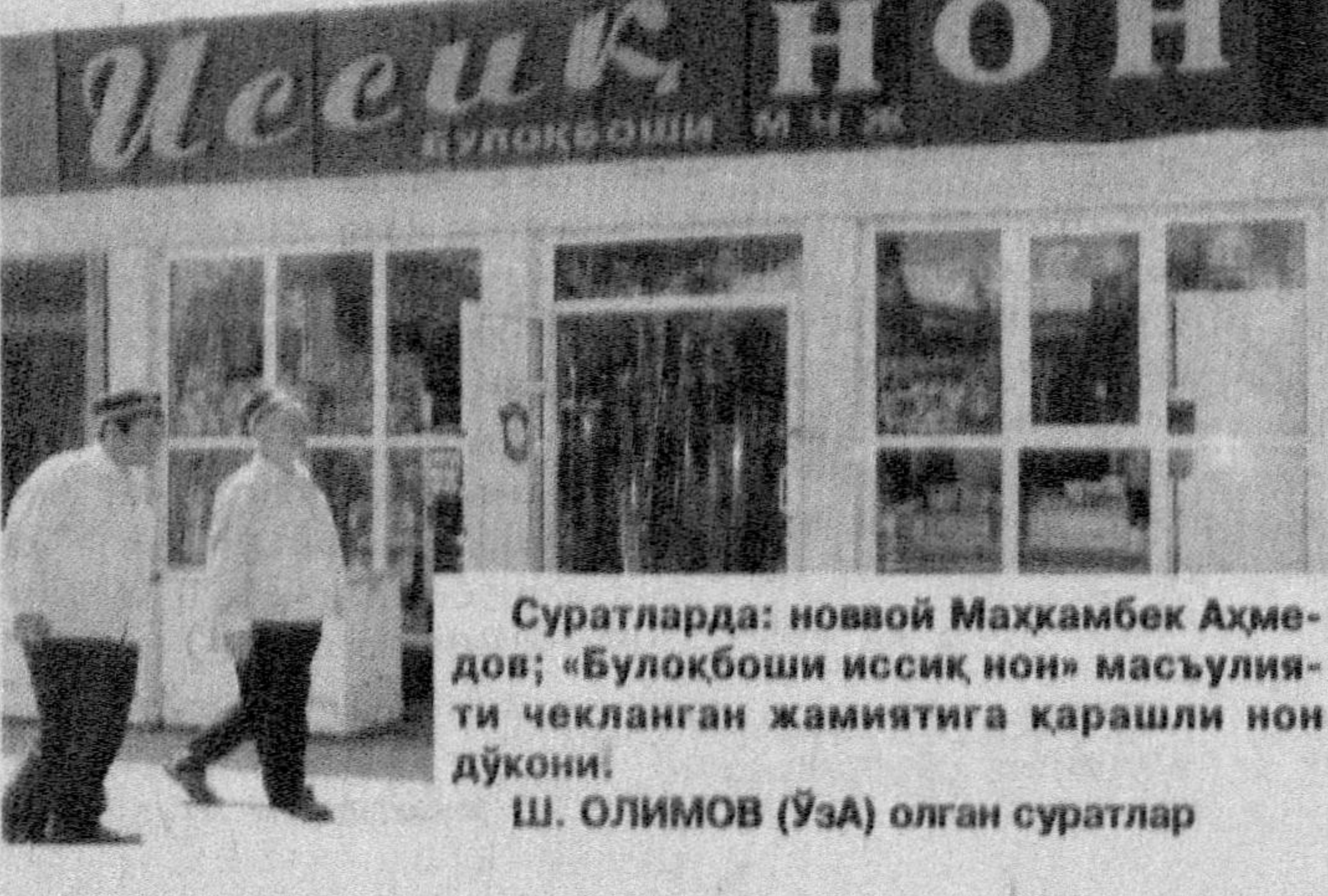
Суратларда: новий Маҳкамбек Аҳмедов; «Булоқбоши иссиқкўн» маъсулияти чекланган жамятига қарашли нон дўкони