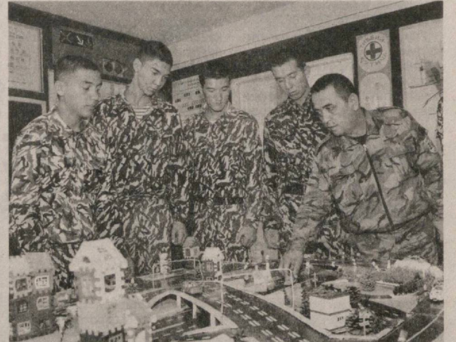
где собраны специальные пособия, научно-техническая и художественная литература. Здесь регулярно проводятся различные мероприятия, направленные на повышение уровня всесторонних знаний молодого поколения, раскрытие интеллектуальных способностей курсантов, что помогает им в дальнейшем прохождении военной службы. П. ХАМДАМ, наш соб. корр.

Важно добавить, что в Наманганской автошколе ОСО «Ватанпарвар» ведется масштабная работа и по духовно-нравственному воспитанию молодежи, будущих защитников Отечества. В их распоряжении большая библиотека,