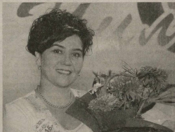
В стране проводится веселая работа по повышению активности женщин, их статуса в обществе. Конкурс