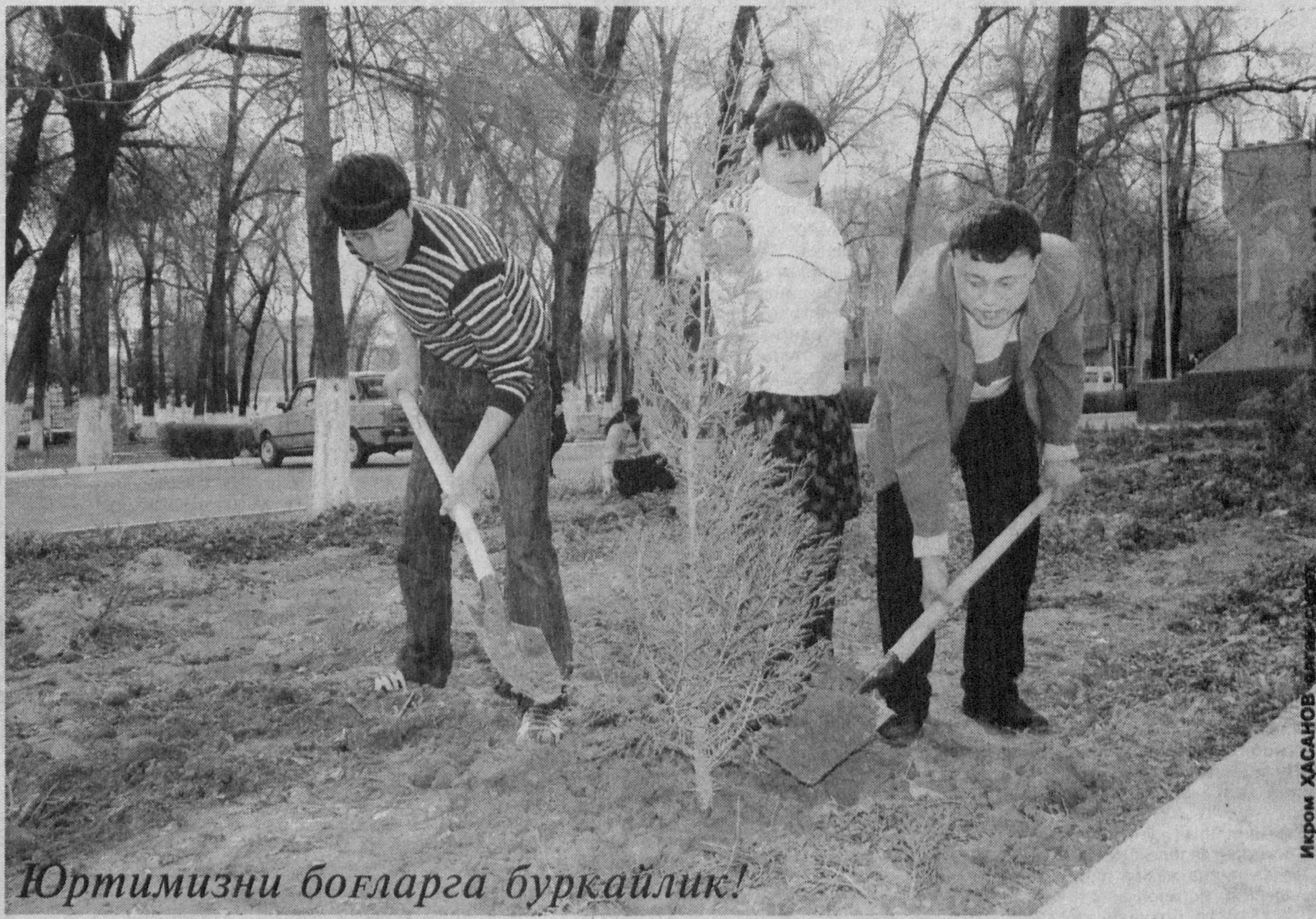
Юртимизни боғларга буркайлик!