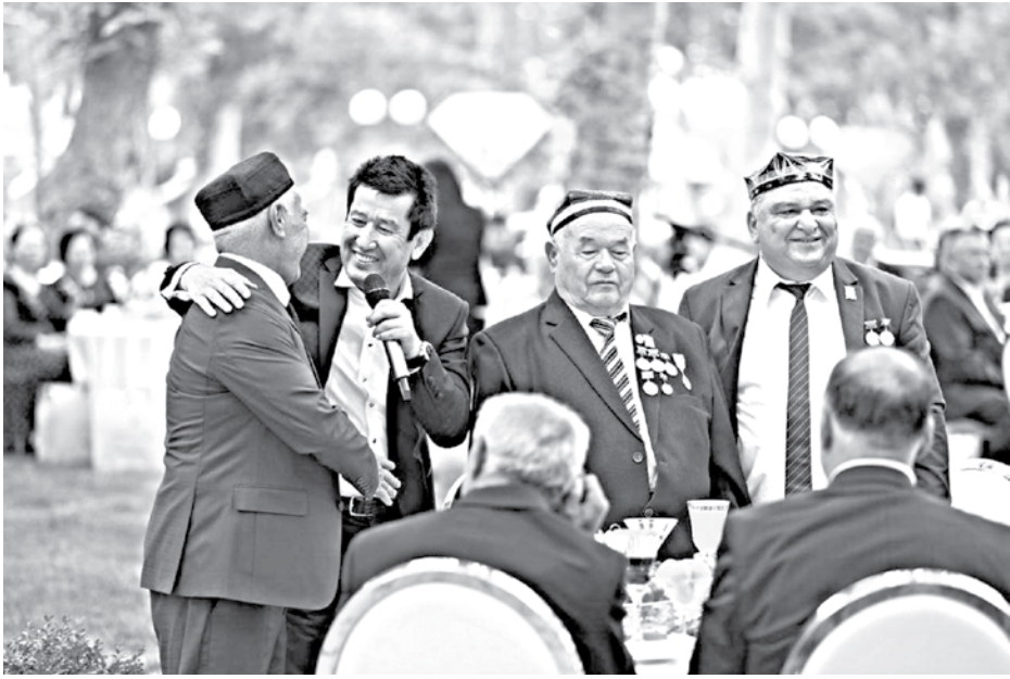
(Давоми. Бошланиш 1-саҳифада)

Маросимда букилмас ирода, матонат ва жасорат намунасини амалда намоеън этиб, ўз ҳаётини Ватанимиз равнақи, бугунги тинч ва оқойишта кунларимиз учун фидо қилган аجدодларнинг муқаддас хотираси ёд этилди.