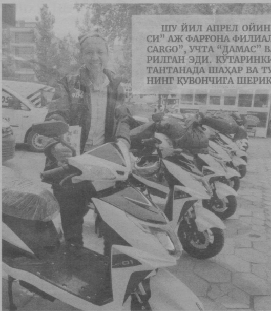
ШУ ЙИЛ АПРЕЛ ОЙИНИНГ 19 КУНИ “ЎЗБЕКИСТОН ПОЧТАСИ” АЖ ФАРҒОНА ФИЛИАЛИ ПОЧТАЧИЛАРИГА ТЎРТТА “CADDY CARGO”, УЧТА “ДАМАС” ВА 50ТА ЭЛЕКТРОСКУТЕРЛАР ТОПШИРИЛГАН ЭДИ. КЎТАРИНКИ РЎХДА ТАШКИЛ ЭТИЛГАН АНА ШУ ТАНТАНАДА ШАҲАР ВА ТУМАНЛАРДАН КЕЛГАН ПОЧТАЧИЛАРИНИНГ ҚУВОНЧИГА ШЕРИК БЎЛГАНДИМ.