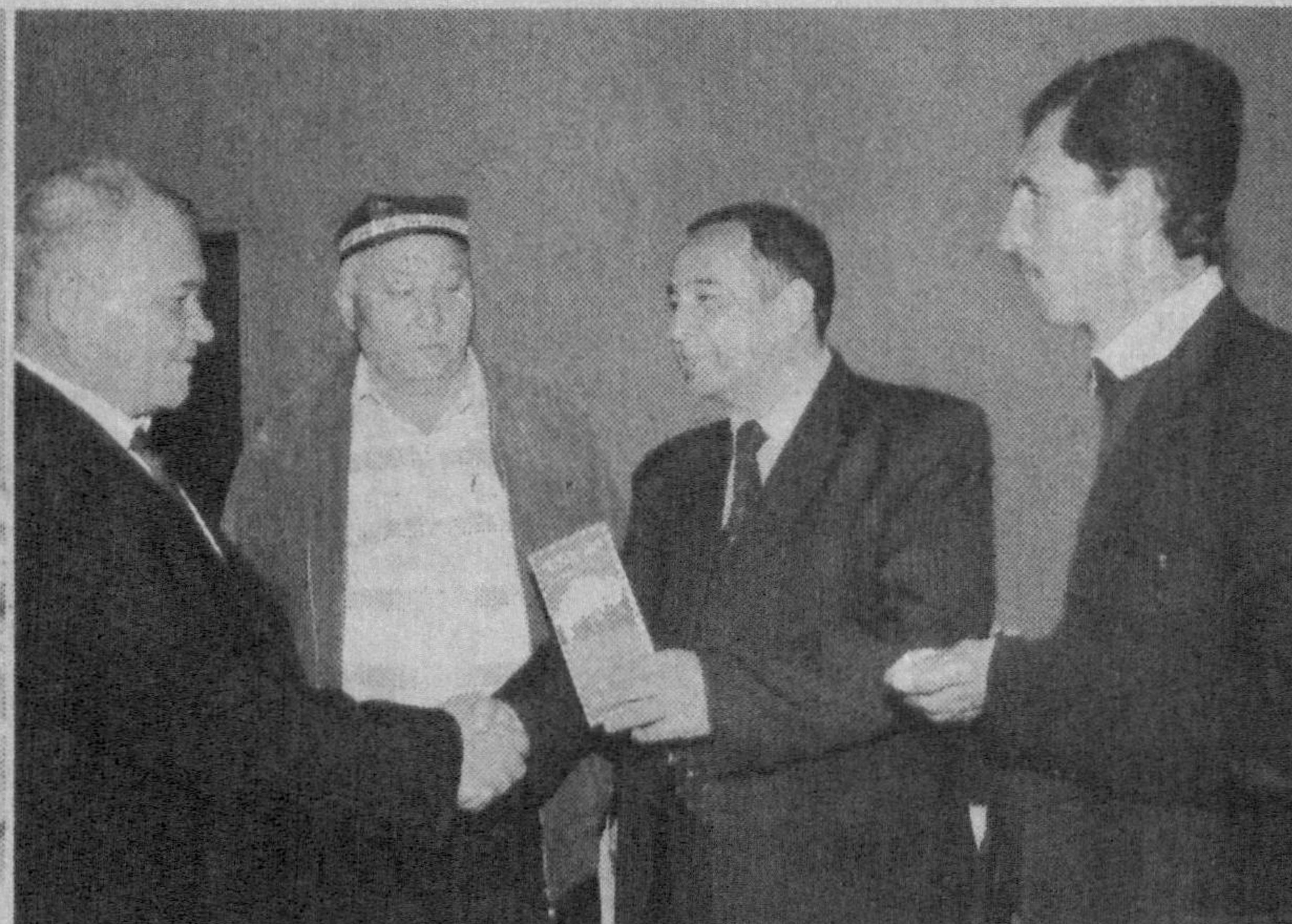
Ўзбекистон Маданият ходимлари касаба уюшмаси Марказий кенгашининг Тошкент вилояти вакиллиги вилоят маданият ва спорт ишлари бошқармаси билан ҳамкорликда Уртачирчиқ тумани «Кум овул» маҳалласида умумхалқ байрами Наврўзга бағишланган тадбир ўтказди.