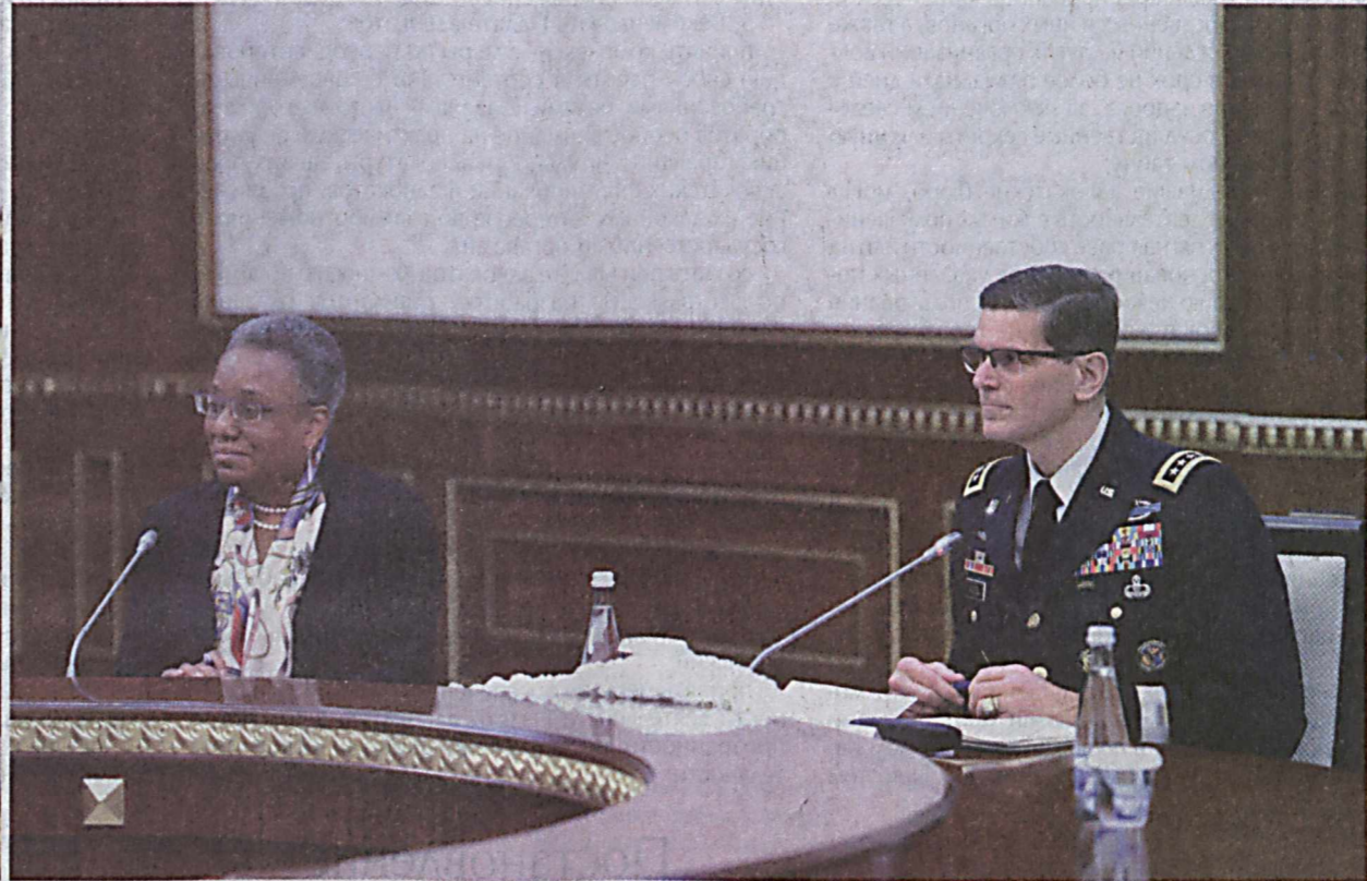
Президент Республики Узбекистан Шавкат Мирзиёев 12 мая принял командующего Центральным командованием Вооруженных Сил США генерала Джозефа Вотела, прибывшего в нашу страну с рабочим визитом.

Глава нашего государства, тепло приветствуя гостя, с глубоким удовлетворением отметил динамично развивающиеся отношения стратегического партнерства и многопланового сотрудничества между Узбекистаном и США, в том числе в политической,