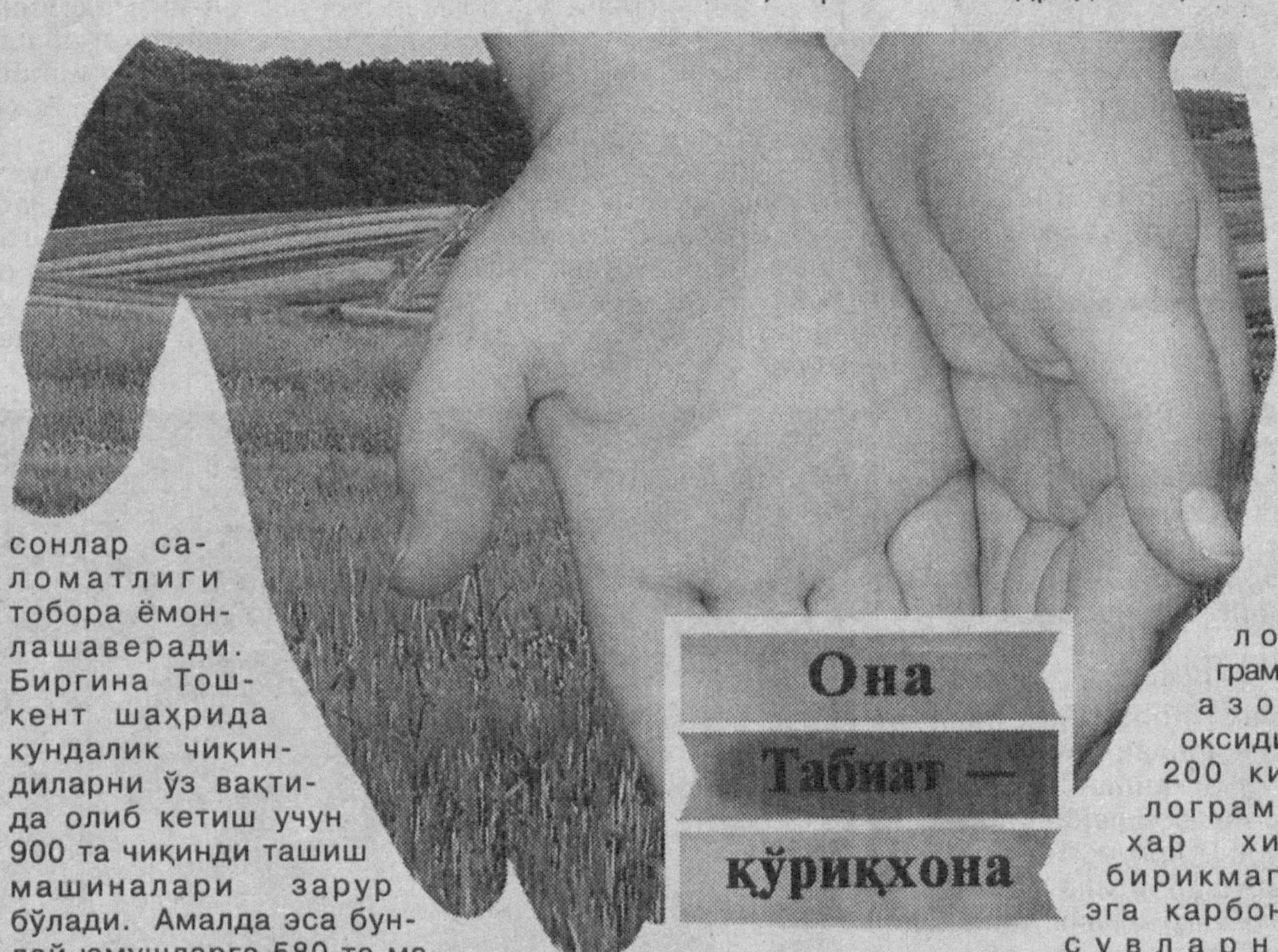
сонлар саноатлиги тобора ёмонлашаверади. Биргина Тошкент шаҳрида кундалик чиқиндиларни ўз вақтида олиб кетиш учун 900 та чиқинди ташуви машиналари зарур бўлади. Амалда эса бундай юмушларга 580 та машина ажратилган. Унинг ҳам 365 таси ишлаб турибди. Шунингдек, маҳалларда ахлатларни солиш учун 20 мингта металл яшиқ(контейнер)лар керак, аммо амалда 4500 та ахлат идишлари мавжуд. Шунинг учун ҳам чиқиндилар бир неча кўнлаб қолиб кетмоқда, натижада, сув, ҳаво, тупроқ ифлосланаётган. Аянчлиси шундаки, ахлатхоналар атрофида пашша, суварак, сиқон ва каламушлар кўпайиб, турли юкумли касалликлар келиб чиқишига имкон яратмоқда.

— Агар биз кўхна Шарқ хонадонларининг турмуш тарзини таҳлил этсак борми, санитария-гигиена қоидаларини ўргатадиган чинакам до-рилфунунга дуч келамиз. Қаранг, бобо-буваларимиз ховли-жойларини тозалашдан аввал шакароб қилиб сув селишни, сўнг супургини сал ҳўллаб супуришни ўқтирганлар. Кундалик чиқиндиларни ховли четидаги ўрага ташлаб устидан тупроқ торганлар. Уларнинг куз пайтида хас-хашакларни тўплаб ёққанини эшитмаганмиз. Чунки хас-чўплар тутуни зарарли эканини қадимгилар яхши билишган. Чиндан ҳам хазонлар тутуни орқали захарли моддалар ҳавога учди ва атмосферани ифлослантирди. Шундай экан, уларни махсус жойларда зарарсизлантириш лозим. Чуқурга кўмиб компостлаш (яъни чиритиш) амалга оширилганда чиқинди ахлатлар бир йил давомида ўсимликлар томонидан яхши ўзлаштириладиган минерал моддаларга айланади. Компостлашда ахлатларнинг ҳарорати кўтарилиб, қаттиқ иссиқ ҳароатида улардаги инсон соғлиғи учун хавфли микроорганизмлар ўз-ўзидан қирилиб кетади.