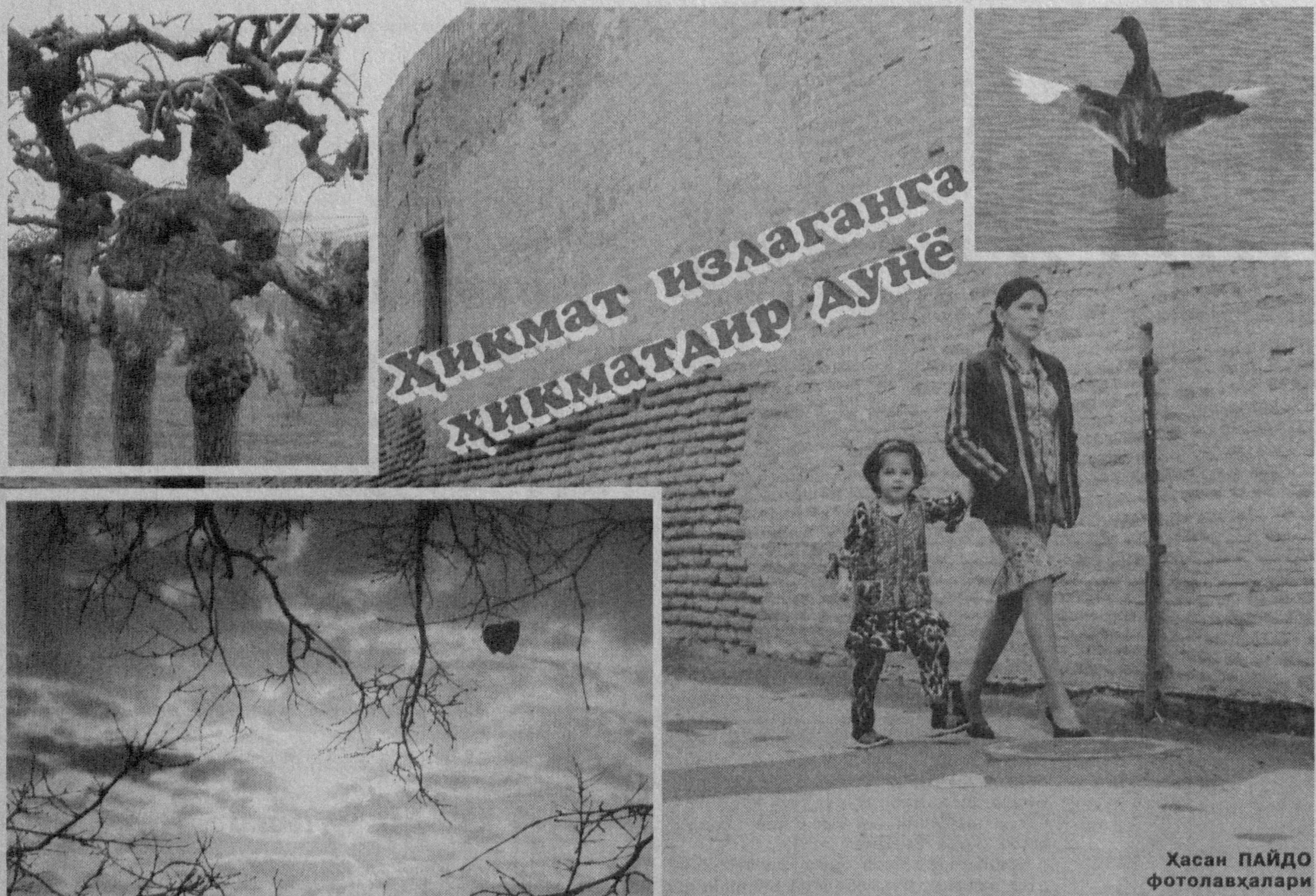
Хикмат излаганга хикматаир дунё