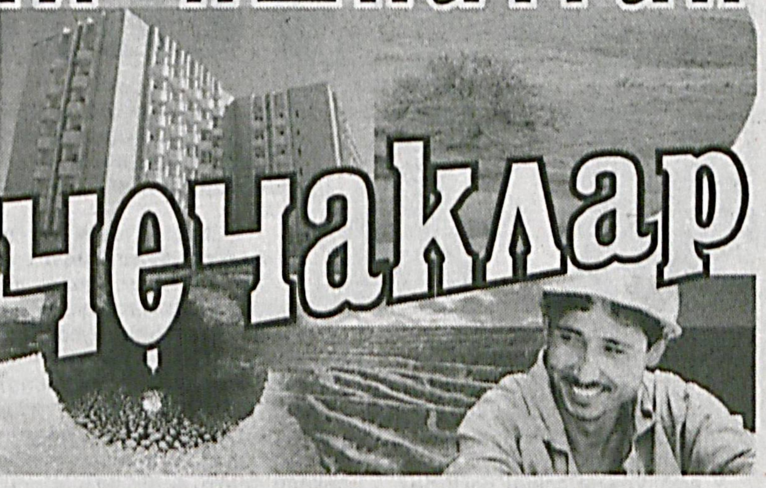
1963 йилда ўқитувчиликдан бошлаган. Кейинчалик «Мингбулок» давлат ҳўжалиғи раҳбарларидан бириға айланди. Она юртида қишлоқ кенгаши ташкил этилғач, унинг бошқарувини қўлиға олди. 1993 йил

онанинг фарзандлари каби ахил. Бу ердаги умумтаълим мактаби ва болалар боғчасида дарс ва машғулотлар 3 тилда олиб борилади. Маиший хизмат кўрсатиш шаҳобчаларининг фаолияти ҳам марказидан фарқ қилмайди. Кўркам маҳалла биносиға кирсангиз, бугунги кунимизға ҳамоҳанг стөнд ва кургазмаларға дуч келиб, жўшқин ҳаёт тафтини ҳис эта-сиз. Қарийб 1,5 соатлик масофа ўтилғач, қирлар ортидан яна бир яшиллик оламиға дуч келамиз. Бу тажрибали оқсоқол, «Шухрат» медали соҳибини Муртазо Муратов раислиғидаги Мингбулок маҳалласи эди. Йўл азаблиридан чағиб, ён-атрофға эҳти соларканмиз, шинам, оқланган уйлар, маиший хизмат