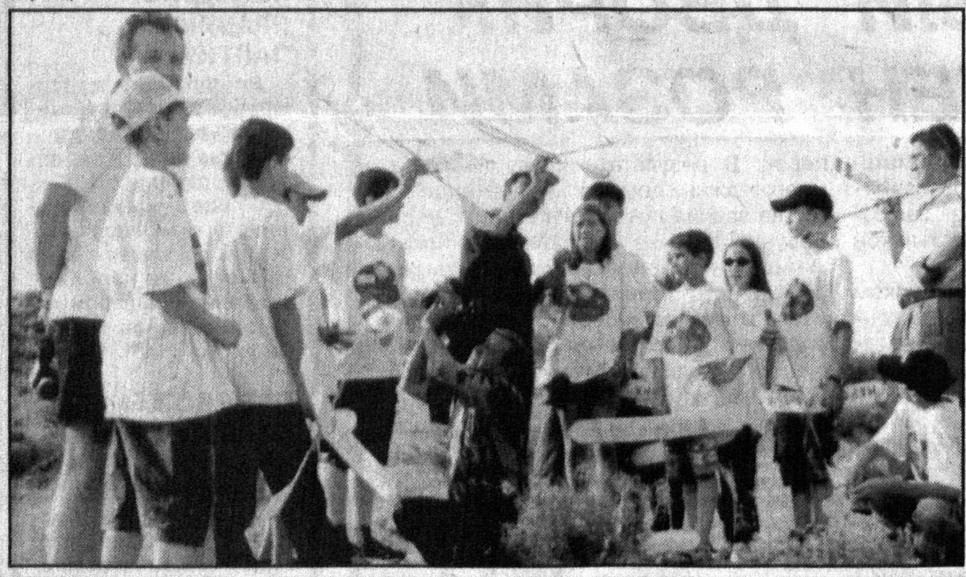
На сцене - дети

Регулярно организуются беседы «за круглым столом», викторины, интеллектуальные игры, посвященные истории, культуре и искусству, проводятся музыкальные мероприятия, что способ-