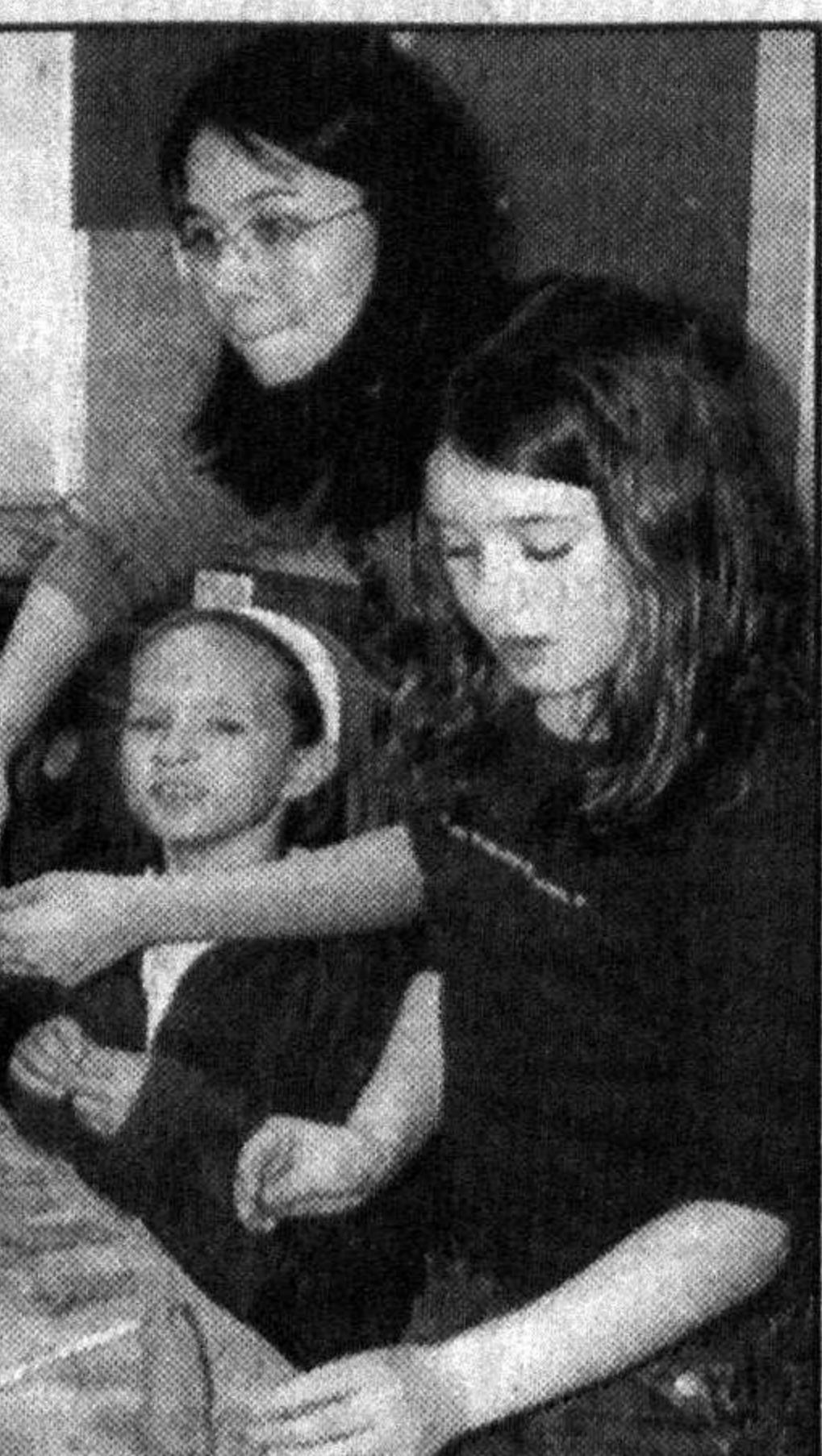
ни здоровья наших детей, об их содержательном отдыхе.

Все это - еще одно практическое проявление большой заботы о подрастающем поколении, укрепле-