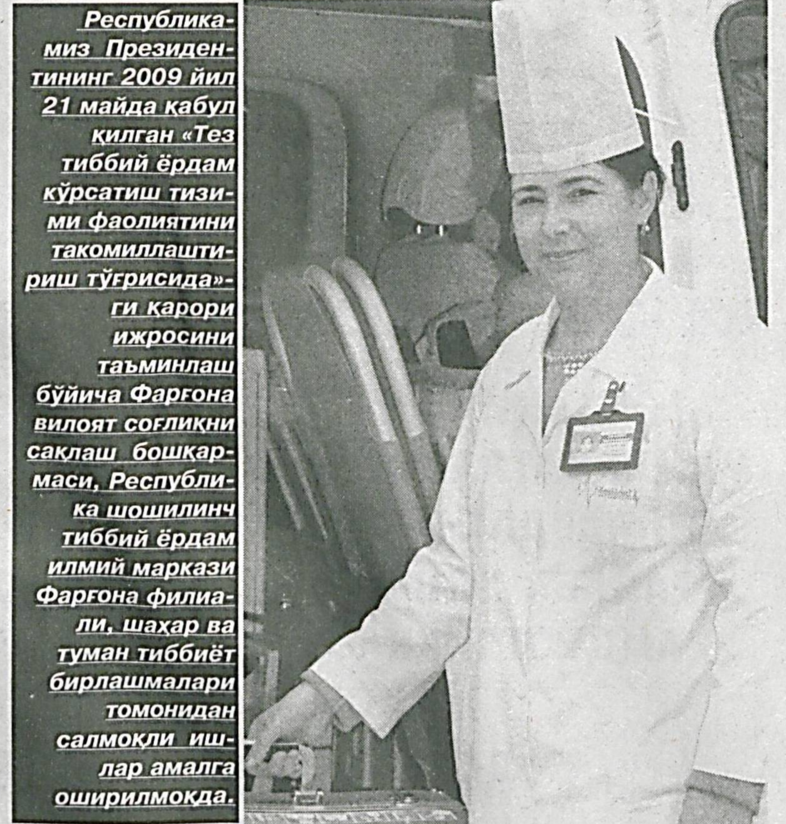
Республика Президентининг 2009 йил 21 майда қабул қилган «Тез тиббий ёрдам кўрсатиш тизими фаолиятини такомиллаштириш тўғрисида»ги қарори ижросини таъминлаш бўйича Фарғона вилоят соғлиқни сақлаш бошқармаси, Республика шойлинич тиббий ёрдам илмий маркази Фарғона филиали, шаҳар ва туман тиббий ёрдам бirlashmalari томонидан салмоқли ишлар амалга оширилмоқда.

Ўзбекистон Республикаси Президенти Тошкент шаҳри, 2010 йил 5 май И.КАРИМОВ