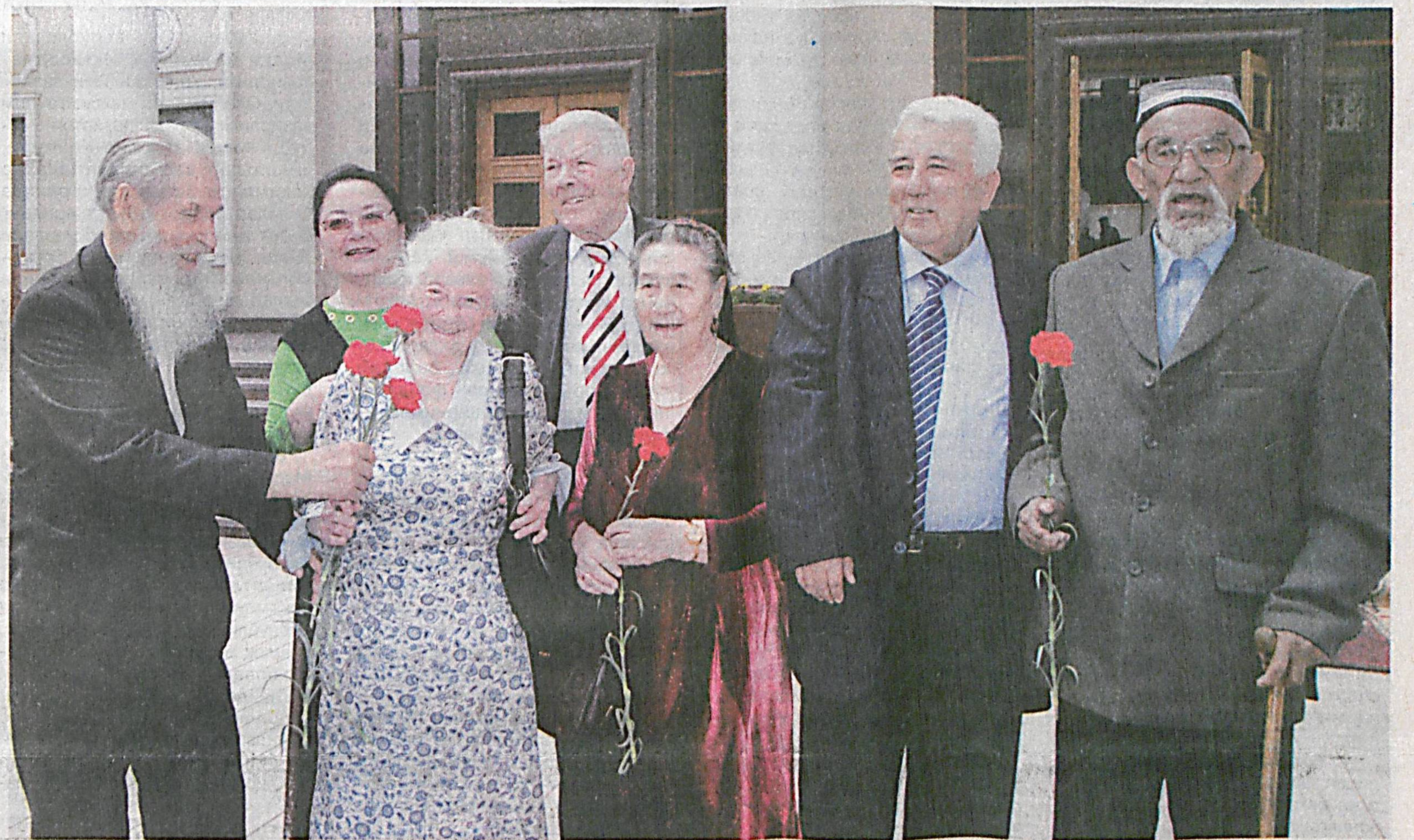
9 май — Хотира ва қадрлаш кuni арафасида Қорақалпоғистон Республикаси, барча вилоятлар ва Тошкент шаҳрида уруш қатнашчилари ва ногиронларига «1941-