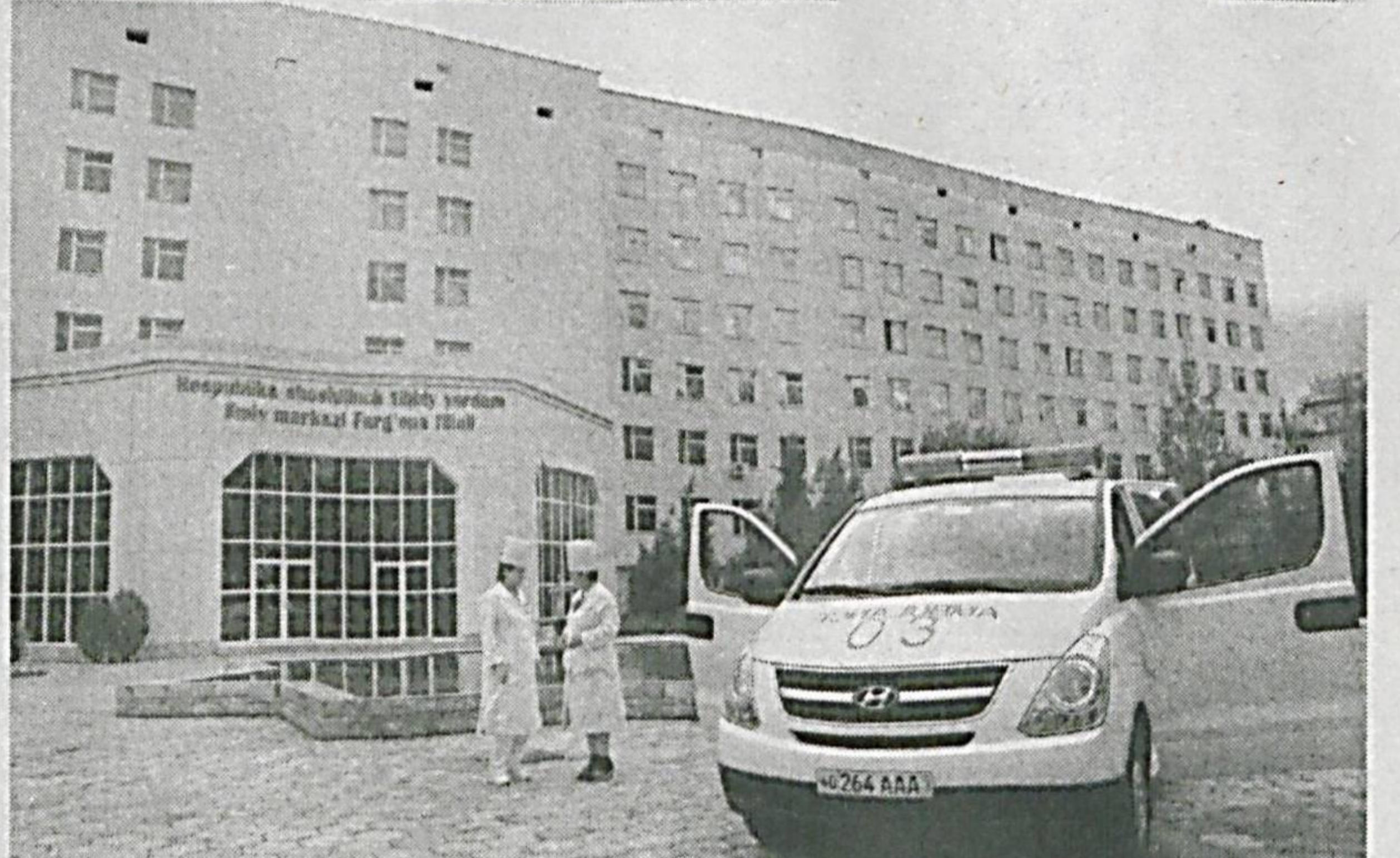
Республика шойлинич тиббий ёрдам илмий марказининг Фарғона филиали таркибиде марказий тез тиббий ёрдам бўлими ҳамда 4 та бўлими мавжуд. Марказий тез тиббий ёрдам бўлими барча қулайликларга эга бўлган янги 19 та санитар автотранспорти, замонавий алоқа воситалари, зарур дори-дармон ҳамда боғлов материаллари билан таъминланган.