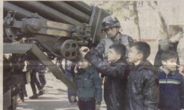
лоят мусиқали драма театри олдидаги Кўксарой майдонида ташкил этилган ҳарбий техника ҳамда қурол-яроғлар кўрғазмаси эса, ҳеч бир томошабинни бефарқ қолдирмади.