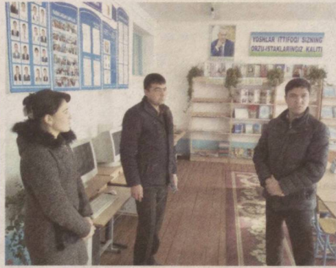
даркор. Зотан, бўлғуси авлоднинг камалию истиқболи учун масъулмиз. Демак, ёшлар етакчисидан меҳнатсеварлик ва ташаббускорликни даврининг ўзи талаб қилмоқда.