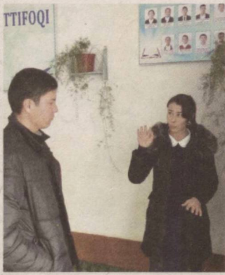
BIR MANZILDA IKKI MANZARA

Ақалли иш кабинетини тартибга келтиришни ўзига эп билмаган Рухсора носоглом маънавий муҳит ҳукмрон оила фарзандлари, ҳуқуқбузарликка мойил ва тарбияси оғир ёшлар билан алоҳида ишлашни эплайди дейсизми? Йўқ, албатта! На илож, ношуд етакчиға аввалиға йўл-йўриқ кўрсатдик. Имкон қадар услубий кўмак ҳам бериладиган бўлди.