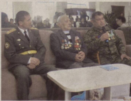
Урганч шаҳридаги Ёшлар марказида бўлиб ўтган тадбирда Иккинчи жаҳон уруши қатнашчилари, Афғонистонда хизмат қилган фахрий жангчилар, миллий армиямиз сафидан нафақага чиққан ҳарбийлар, жамоат ташкилотлари ходимлари ҳамда ўқувчи-ёшлар иштирок этди.

Ёшлар иттифоқининг Хоразм вилояти кенгаши Ватан ҳимоячилари куни муносабати билан бир қанча лойиҳаларга старт берди.