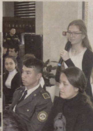
Уч авлод вакилларининг қизгин ва самимий суҳбат чоғида бугунги кунда Ўзбекистон Республикаси

Қуроли Кучлари тизимида амалга оширилаётган ислохотлар, ёшларга эътиборнинг юксаклиги эътироф этилди.