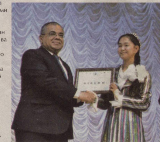
палатаси депутатлари, навоийшунос олимлар, кенг жамоатчилик вакиллари иштирок этди.

Мумтоз шеърятимиз ихлосмандлари — жами 14 нафар иштирокчи “Фарҳод” маданият саройида ғазални ёддан айтиш, ифодали ўқиш ва ёзма тарзда шарҳлаш шартлари бўйича ўзаро беллашди. Мазкур лойиҳа ёшлар ўртасида китобхонликни тарғиб этиш, ҳазрат Навоийнинг ўлмас ижодида меҳрини ошириш, улуғ шоир илгари сурган инсонпарварлик гоёларини қалбига жо айлашга хизмат қилди. Танловнинг очилиш маъросида Олий Мажлис Қонунчилик