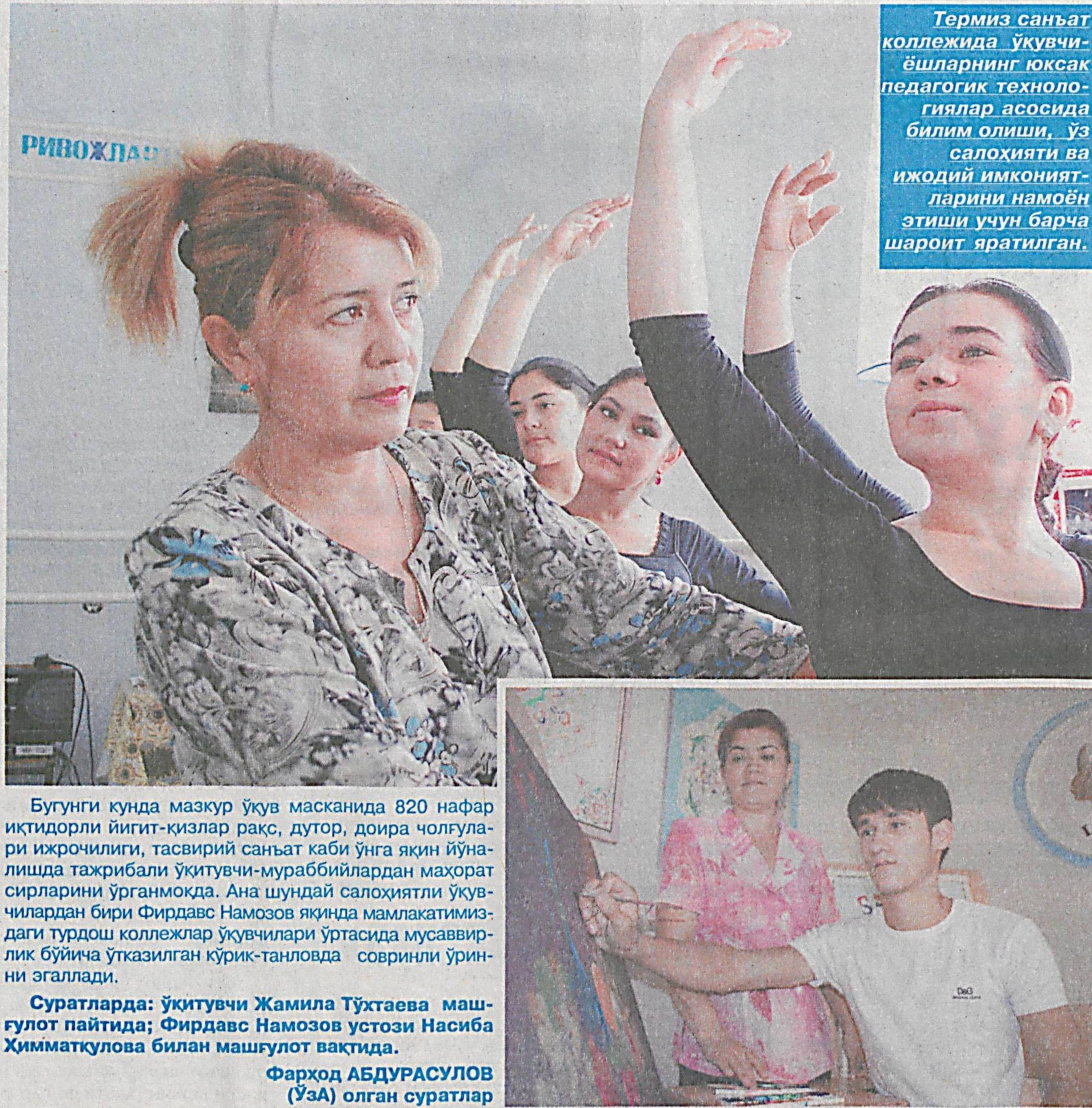
Бугунги кунда мазкур ўқув масканида 820 нафар иқтисодчи йигит-қизлар рақс, дутор, доира чолғулари ижрочилиги, тасвирий санъат каби ўнга яқин йўналишда тажрибали ўқитувчи-мураббийлардан маҳорат сирларини ўрганмоқда...