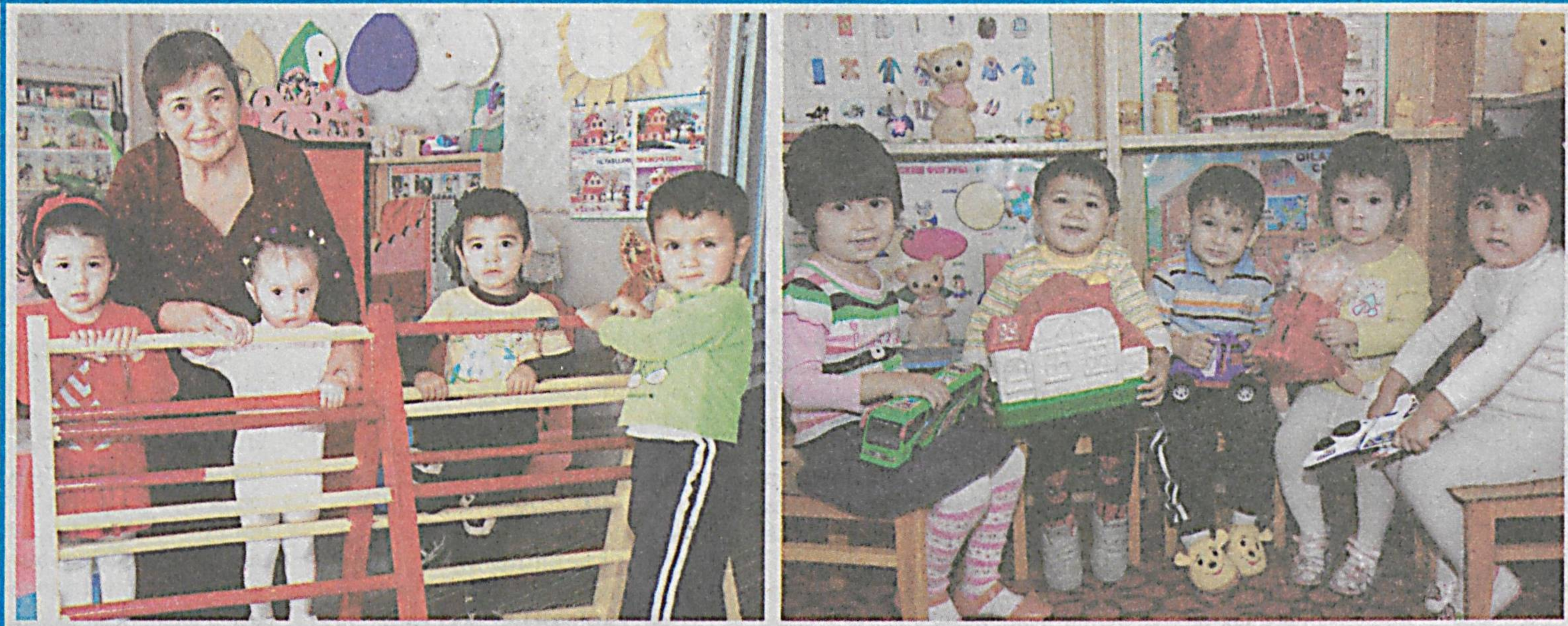
Пойтахтимизнинг Яққасарой туманидаги «Мажнунтол» номли 249-мактабгача таълим муассасасида ёш авлоднинг соғлом ва барқамол этиб тарбиялашга жиддий эътибор қаратилмоқда. Болажонларнинг дунёқарашини шакллантиришда турли усуллардан самарали фойдаланилмоқда. Бу борада мутахассис ва тарбиячилар ҳар бир тарбияланувчининг феъл-атвори ва қизиқишини ҳисобга олиши яхши самара берайтир. Улар ўқиш-ёзишни ўзлаштирган ҳолда мактабга қадам қўйишяпти.

Айни кунларда Фотима 15 октябрда пойтахтимиздаги «Универсал» спорт саройида бўлиб ўтаётган республика чемпионатида пухта ҳозирлик кўрмоқда. Мақсади — чемпион бўлиш.