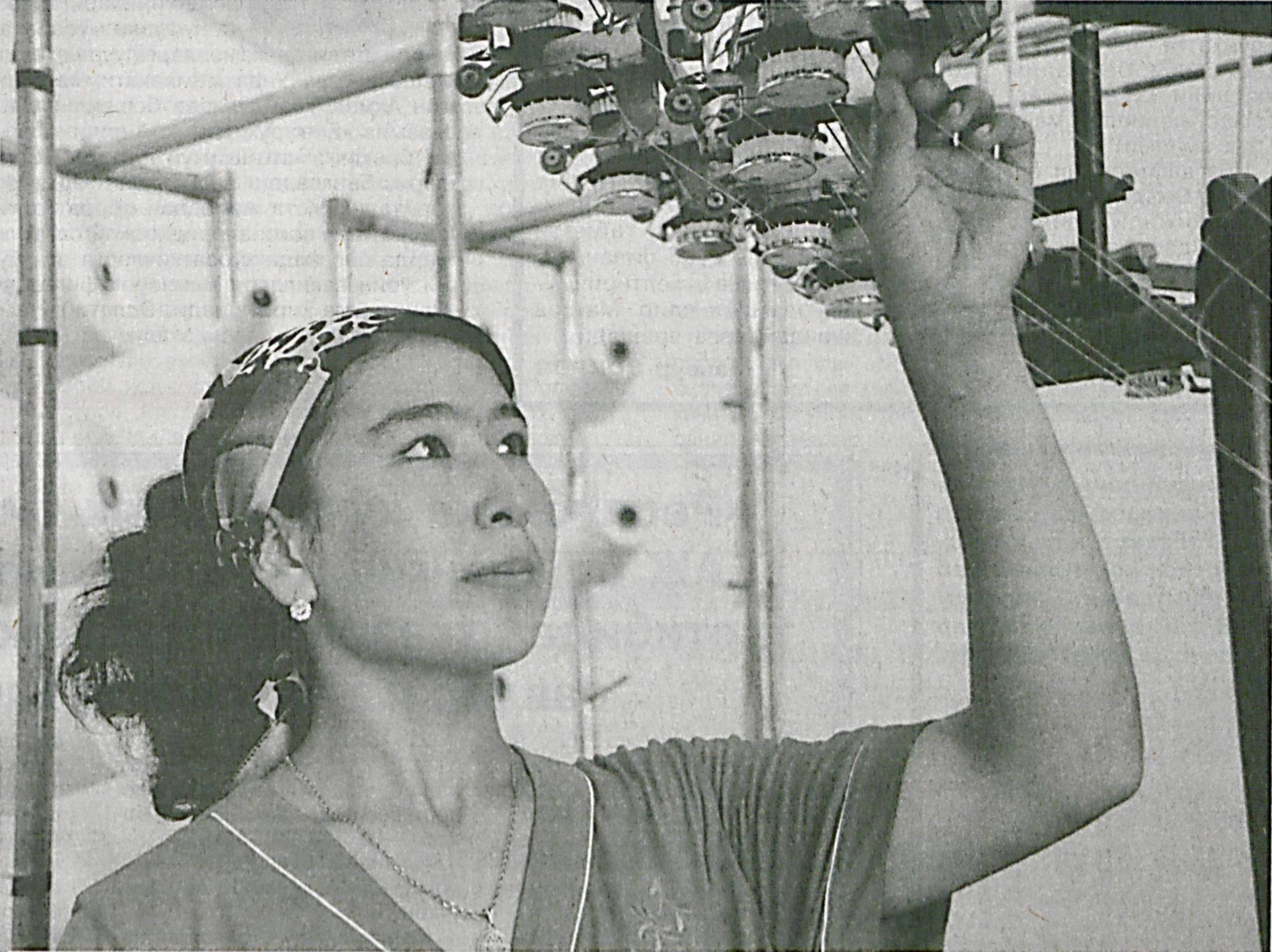
Балиқчи туманидаги «Балтексгранд» масъулияти чекланган жамиятида тўқилаёт- ган трекотаж матолари харидорларға манзур бўлимоқда.

Жорий йилнинг феврал ойида ўз фаолиятини бошлаган ушбу корхонада ўн икки нафар йигит-қиз иш билан таъминланди.