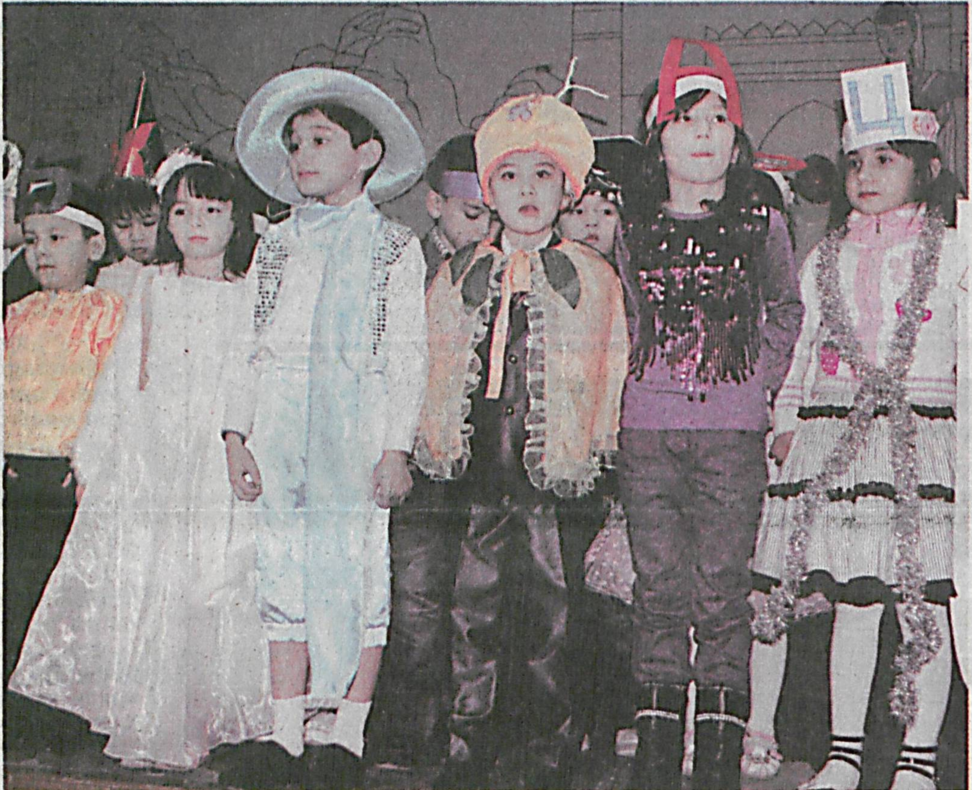
Янги йил арафасида мамлакатимизнинг барча мактабларида савдохонлик байрамлари қизгин тайёргарлик билан ўтаяпти. Жумладан, пойтахтимиздаги 110-умумтаълим мактабида ҳам бу тадбир катта кўтаринкилик билан ўтказилди. Турли эртак қаҳрамонлари кийфасидаги болажонларнинг қувончини кўриб, беихтиёр ҳавасингиз келади.