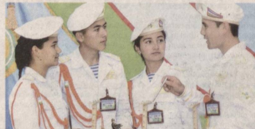
хуудудларидаги академик лицей ва касб-хунар коллежлари жамоалари қамраб олинди. 2011-2017 йиллар мобайнида мусобақаларда 21 минг нафарга яқин ўқувчи иштирок этган.

Ўзбекистон Республикаси Миллий хавфсизлик хизмати чегара қўшинлари ҳамда Ёшлар иттифоқи ҳамкорлигида анъанавий тарзда ўтказиб келинаётган мазкур мусобақада эндиликда мактаб ўқувчилари ҳам қатнашиши мумкин.