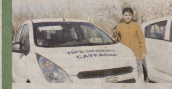
Автомашиналар Ёшлар иттифоқининг шаҳар ва туман кенгашлиари раисларига ўн йиллик имтиёзли кредит асосида тақдим этилган.