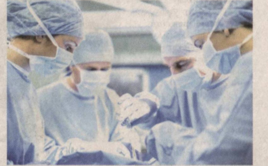
фаолиятини оилавий поликлиникалар

Ҳукумат Тошкент тиббиёт академиясининг Термиз филиали ташкил этиш тўғрисидаги қарорни қабул қилди. Янги бўлинма юридик шахс мақомида фаолият кўрсатмоқда. Жорий ўқув йили учун филиалга контракт асосида 300 нафар абитуриент қабул қилинди. Ўқишни тасмоллагач, улар профессионал