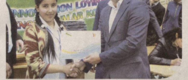
йигит-қизлар кун поёнида Ёшлар иттифоқи туман кенгашининг махсус диплом ва эсдалик совға-