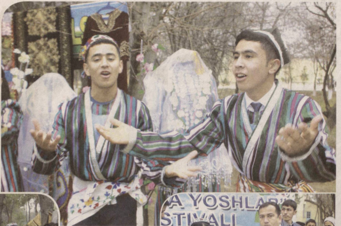
лангани ҳам алоҳида эътиборга моликдир. Миллий либослар дефилеси

доирасида қизилтепалик ёш дэзайнеру чевар қизлар янги ижод намуналарини халқ ҳўкмига ҳавола этиб, кўпнинг олқишига сазовор бўлди.