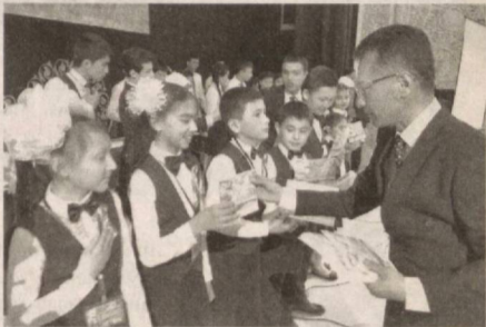
Учта шартдан иборат беллашувда ўқувчи-ёшлар ўз тенгдошларининг ижтимоий фаоллигини оширишга хизмат қиладиган

Жиззах вилояти мусикали драма театрида "Энг намунали сардорлар кенгаши" танловининг худудий босқичи ўтказилди. Унда "Камалак" болалар ташкилоти аъзоларидан шакллантирилган 13 жамоа финалга чиқиш учун кураш олиб борди.