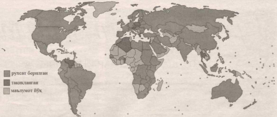
■ рухсат берилган ■ тақиқланган ■ маълумот йўқ

Айни вақтда 33 турдаги трансген ўсимликлар (ГМО) одамлар томонидан озиқ-овқат сифатида кенг қўлланилмоқда: картошка, папая, ошқовоқ, бақлажон, олма, маккажўхори, соя, ловия, қовун, гуруч, помидор, ширин