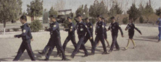
Йигит-қизларнинг ҳарбий-ватанпарварлик руҳини оширишга қаратилган лойиҳа

Тойлоқ туманидаги ҳарбий қисмда "Ёш чегарачилар" кўрик-танловининг Самарқанд вилояти босқичи бўлиб ўтди.