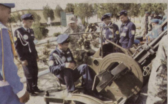
да Булунгур педагогика ва спорт коллежининг "Баркамол авлод", Ургут спорт ва хизмат

кўрсатиш касб-ҳунар коллежининг "Лочин", Тойлоқ маиший хизмат курсатиш касб-ҳунар коллежининг "Темур ўғлонлари" жамоалари ғолиблик учун баҳс олиб борди. Ўқувчилар сафда юриш, автоматни қисмларга ажратиш-йиғиш, турникда тортилиш, юз ва минг метр масофага югуриш бўйича мусобақалашди. Шунингдек, ижтимоий-сиёсий, ҳуқуқий билимининг синовандан ўтказиб, Президентимиз таъинланган ҳамда инглиз тилидан тузилган тест саволларига жавоб берди. Ҳар бир шартни нуфузли ҳақамлар ҳайъати баҳолаб берди. Якуний ҳулосага кўра, булунгурликлар 1-ўринни эгаллади. Энди "Баркамол авлод" жамоаси лойиҳанинг финал босқичида иштирок этиши мумкин. Барча ғолиблар Ёшлар иттифоқи ҳудудий кенгаши раиси ҳамда вилоят ҳокими ўринбосари қўлидан диплом ва эсаалик совғаларни қабул қилиб олди. Шундан сўнг ташкил этилган ҳарбий техника ва қурол-яроғлар кўргазмаси тадбирга якун ясади.