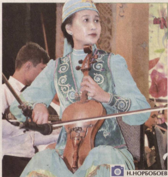
Ўзбекистон Республикаси Маданият вазирлиги, "Соғлом авлод учун" халқаро хайрия фонди, Ёшлар иттифоқи ва бошқа ташкилотлар ҳамкорлигида анъанавий тарзда ўтказиб