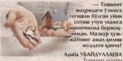
— Тошкент шаҳридаги ўзимга тегишли бўлган уйни сотиш учун укамга ишончнома бермоқ- чиман. Мазкур ҳуж- жатнинг амал қилиш муддати қанча? Алиба УБАЙДУЛЛАЕВА Тошкент шаҳри

Саволга ҳуқуқшунос Бекзод МУСАЕВ жавоб беради: