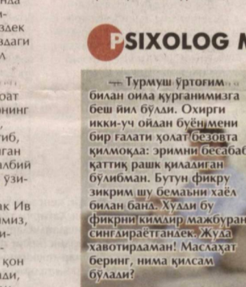
Лобар ДУСТАМОВА Янгиёулдувани