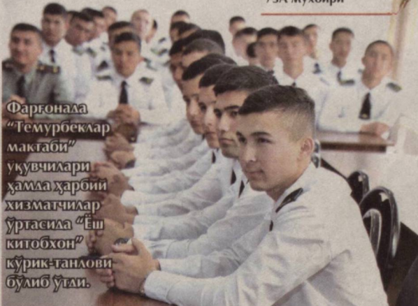
Фарғонада “Темурбеклар мактаби” ўқувчилари ҳамда ҳарбий хизматчилар ўртасида “Ёш китобхон” кўрик-танлови бўлиб ўтди.

қаратилаётганини таъкидлади. Президентимизнинг 2017 йил 13 сентябрдаги “Китоб маҳсулотларини нашр этиш ва тарқатиш тизимини ривожлантириш, китоб мутлоаси ва китобхоналик маданиятини ошириш ҳамда тарғиб қилиш бўйича комплекс чора-тадбирлар дастури тўғрисида”ги қарори бу борада муҳим дастуриламал бўлаётди.