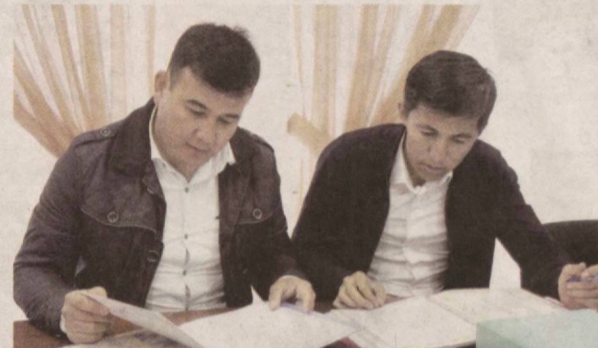
Яқинда Қашқадарё вилояти бўйича ҳужжат топширган 64 нафар номзод вилоят ҳокимлиги ва жамоат ташкилотлари вакиллари билан иборат ҳудудий комиссия томонидан саралаб олинди. Бун-

Президентимизнинг 2017 йил 21 ноябрдаги қарорига мувофиқ, ўқишдаги муваффақиятлари, ижтимоий фаоллиги ва истеъдоди билан тенгдошларига ўрнэк бўлиб келаётган йигитларни “Мара Ҳғлон” давлат мукофоти билан тақдирлаш кўзда тутилган.