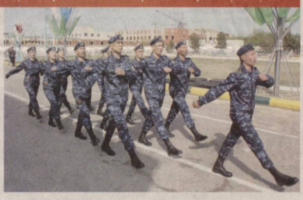
даражада бажарган Меъдонларнинг “Бургутлар” жамоаси биринчи ўринни эгаллади.