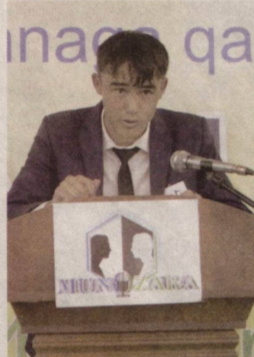
Беллашувда иштирок этиш учун Бухоро, Сурхондарё ва мезбон вилоятнинг умумтаълим мактаблари, ўрта махсус, касб-ҳунар ҳамда олий таълим муассас-

Қашқадарё вилоятида “Мунозара” турнирининг “Воҳа кубоги” баҳслари бўлиб ўтди