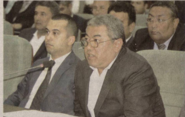
хўжалигини инновацион босқичга кўтариш, Қарши шаҳридан уй-жой олиш, тadbirkорлик, чорвачилик ва паррандачилик йўналишларида илгор хорижий тажрибага асосланган янги бизнес лойиҳаларни амалга ошириш

Қашқадарё вилояти ҳокими, Ўзбекистон Республикаси Олий Мажлиси Сенати аъзоси Зафар Рўзиев кўни-кеча ҳудудда яқунланган "Ёшлар ҳафталиги" доирасида хориждаги тенгдошларимиз билан видеоконференцадоқ тизими орқали мулоқот қилди.