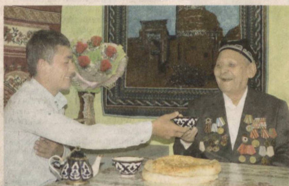
Хотира ва қадрлаш куни муносабати билан Ёшлар иттифогининг Хоразм вилояти кенгаши фаоллари фахрий