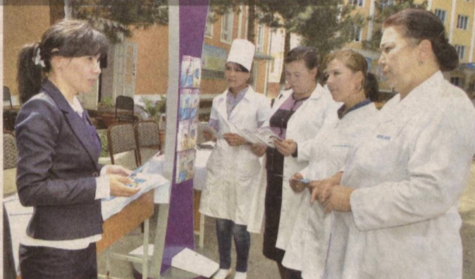
Қўқон шаҳар тиббиёт коллежида бўлиб ўтган меҳнат ярмаркасидаги манзара буткул ўзгача.

Мутасаддининг гапига ишонмадик. Сабоби айтганлари рост бўлганда эди, бир ҳафтада ишсизлик билан боғлиқ 1 минг 172 та муаммони аниқламаган бўлардик. Ҳўжакурсинлик ҳам эви билан-да!