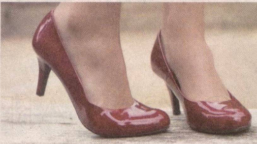
"СОЧИМ ХАЛАҚИТ БЕРДИ"

Институт оstonасига илк қадам қўйган кунни танишган, турли ҳуудлардан келган йигит-қизларнинг баъзилари вақт ўтиб узғариб қолади. Уларнинг кийиниши ва сўзлашуви, ҳатто салом-алиғидаги калондимогликни сезиб, жаҳлингиз чиқиши тайин. Ҳазилни унутиб, ўзга "дуна"ларга "учиб кетгани"га ачинасан, киши.