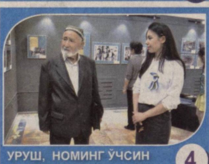
УРУШ, НОМИНГ ЎЧСИН ЖАҲОНДА 4