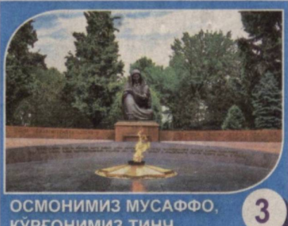
ОСМОНИМИЗ МУСАФФО, КЎРҒОНИМИЗ ТИНЧ 3