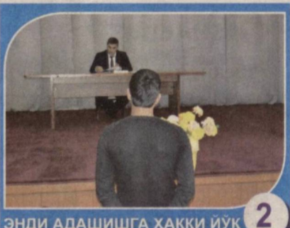
ЭНДИ АДАШИШГА ҲАҚҚИ ЙЎҚ 2