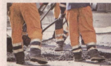
Адлия вазирагининг "Ҳуқуқий ахборот" каналдан олинди.

Мени бир нарса қизиқтиради. Баъзан йўллар қовлаб қўйилади-да, ойлари давомида таъмирланмасдан ётади. Кўп ҳолларда ҳатто оғоҳлан-тирувчи белги ҳам қўйилмайди. Шундай пайтда транспорт ҳолати рўй берса, йўлни қовлаган ёки шу йўлга масъул ташкилот жавобгар бўладими-йўқми? Бу ҳолатда қарга мурожаат этиш мумкин?