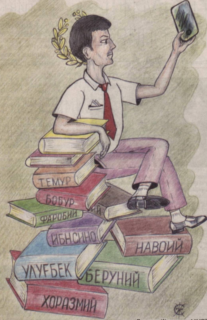
Рассом: Жаҳонгир МИРЗО

Боболар мероси буюк, ранг-баранг, Болалари неларга маҳлиё, қаранг!