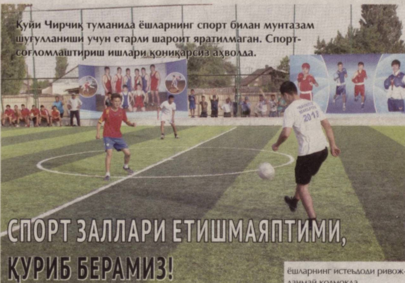
Қуйи Чирчиқ туманида ёшларнинг спорт билан мунтазам шугулланиши учун етарли шароит яратилмаган. Спорт-соғломлаштириш ишлари қониқарсиз аҳволда.

салбий тенденцияга барҳам бериш мақсадида наврасталарнинг ҳуқуқий онгини ўстиришга хизмат қилаётган турии учрашувлар, танловлар ўтказишга келишиб олинди. Шу билан бирга, диний экстремистик оқимларга қўшилган ҳамда носоғлом маънавий муҳит ҳукмрон оилалар билан индивидуал шугулланиш тизими йўлга қўйилди. Маҳалаларда ўтказилаётган сайёр судларни кўпайтириш, ёшларга айбланувчиларнинг аянчи тақдирини ўрнак қилиб кўрсатиш ҳам ижобий натижа бериши шубҳасиз. Шунда иллатлар оёғимизга болта урмайди.