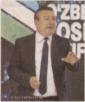
Р.НА ЗАРМАТОВ Даставвал мамлакатимизда аҳоли, айниқса, ёшлар ўртасида жиноятчилик ва ҳуқуқбузарликларнинг олдини олиш

Ёшлар пресс-клубининг навбатдаги сессияси "Адашганлар" ҳужжатли фильми муҳокамаига бағишланди. Унда Ёшлар иттифоқи ва Ички ишлар вазирлиги мутасаддилари, кенг жамоатчилик вакиллари, журналистлар иштирок этди.