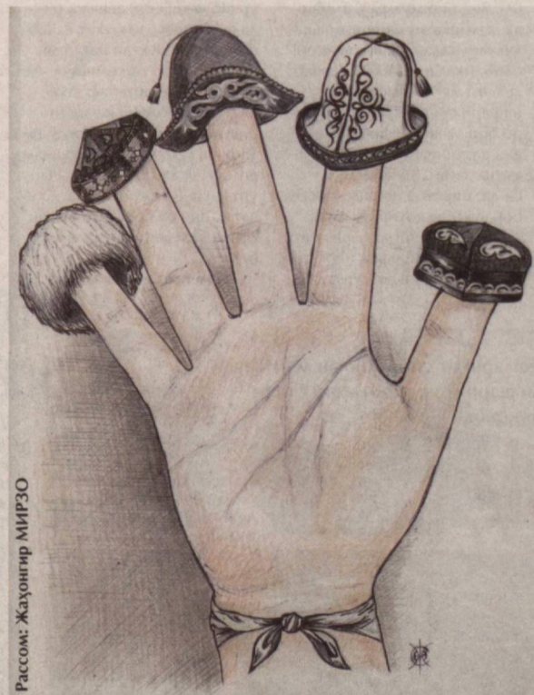
Рассом: Жаҳонгир МИРЗО