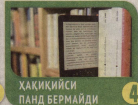
ҲАҚИҚИЙСИ ПАНД БЕРМАЙДИ