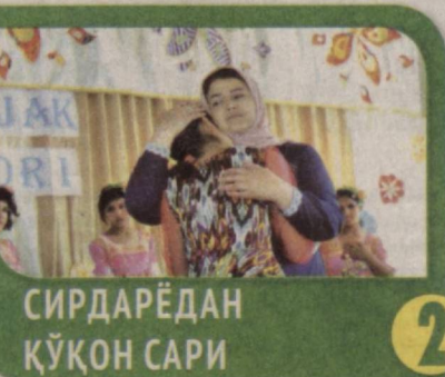
СИРДАРЁДАН ҚЎҚОН САРИ