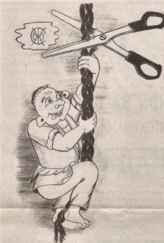
Шерташвир муаллифи: Жаҳонгир МИРЗО