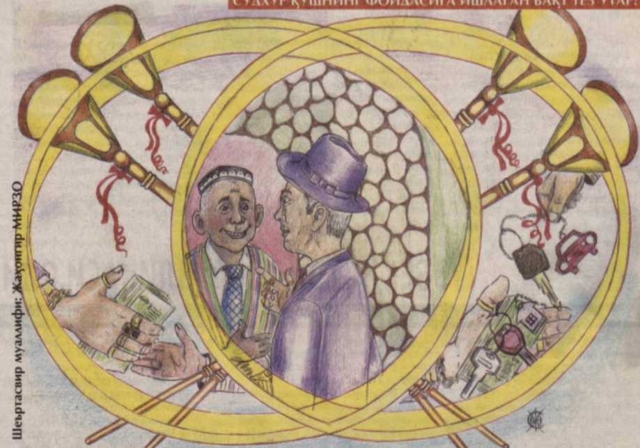
Шеъртаъбир муаллифи: Жаҳонгир МИРЗО

ОРЗУ-ҲАВАС, ДАБДАБАГА БОРИНГ БЕРИБ, ҚАРЗ КҮТАР! СУДХҲР ҚҮШНИНГ ФОЙДАСИГА ИШЛАГАН ВАҚТ ТЕЗ УТАР!