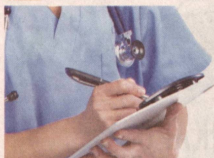
— Республика ихтисослаштирилган илмий-амалий тиббиёт марказлари хизматидан кимлар имтиёзли фойдаланишига ҳаққи?