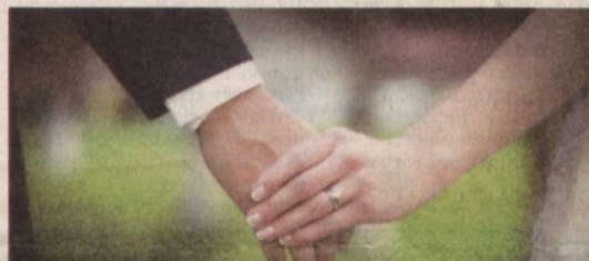
Ўзбекистон Республикаси ҳудудидан никоҳ тузилгани қайда этиш учун 34 минг 448 сўм миқдорда давлат божи ҳамда 25 минг 836 сўм миқдорда Герб йиғими ундирилади.