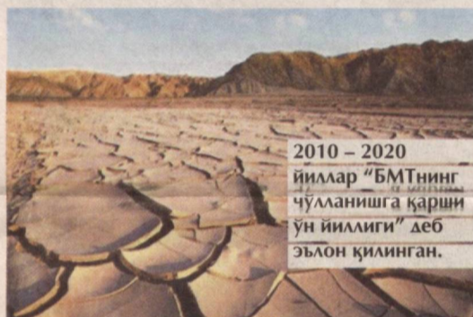
2010 – 2020 йиллар “БМТнинг чўлланшига қарши ўн йиллиги” деб эълон қилинган.