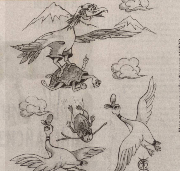
Шеър-тасвир муаллифи: Жаҳонгир МИРЗО