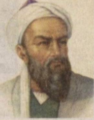
Абу Райхон Беруний "Қадимги халқлардан қолган ёдгорликлар" асарини 27 ёшида ёзиб тугатган.