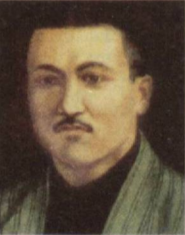
Абдулла Қодирий "Ўтган кунлар"ни 28 ёшида эълон қилган.