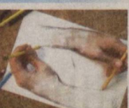
Иқола қўлини баравар бошқариб, ишлата олаётган одамлар амбидекстерлар деб аталади. Улар сай-ёрамыз аҳолисининг фақат 1 фоизини ташкил қилади.