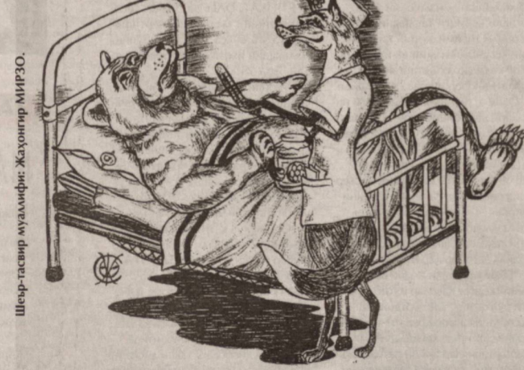
Шеър-тасвир муаллифи: Жаҳонгир МИРЗО.