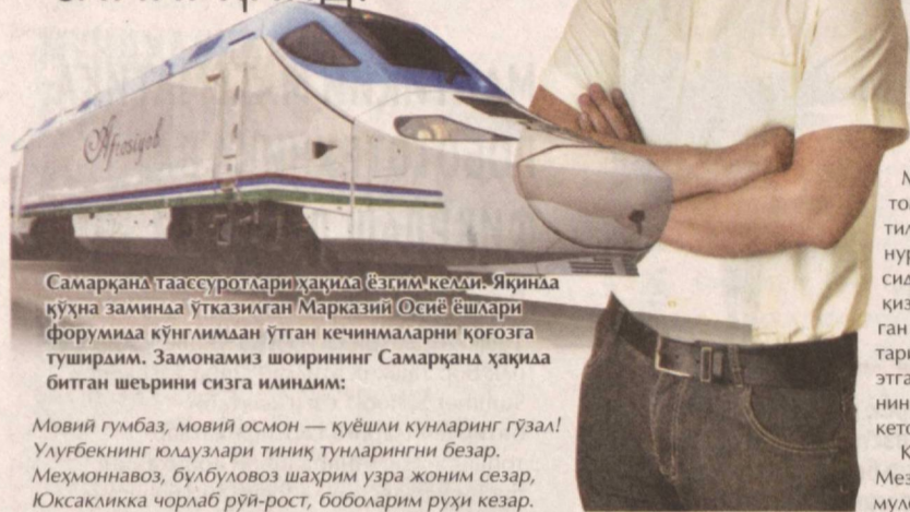
Самарқанд таассуротлари ҳақида ёзгим келди. Яқинда қўхна заминда ўтказилган Марказий Осиё ёшлари форумида кўнглимдан ўтган кечинмаларни қозоғга туширдим. Замонамиз шoirининг Самарқанд ҳақида битган шеърини сизга илдиним:

Мовий гумбаз, мовий осмон — қуёшли кунларинг гузал! Улуғбекнинг юлдузлари тиниқ тунларингни безар. Меҳмоннавоз, бўлбуловоз шахрим узра жоним сезар, Юксакликка чорлаб рўй-рост, боболарим руҳи кезар.