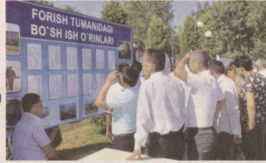
ходимлари қизиқувчиларни ўқиш ва жамоат ишларида фаол йигит-қизлар, шунингдек, ёш тадбиркор ҳамда фермерларга тақдим этилаётган имтиёзлар

Тадбир вилоят ҳокимлиги, прокуратура, Ёшлар иттифоқининг худудий кенгаши ва бандлик бош бошқармаси ҳамкорлигида ташкил этилди. Унинг доирасида аҳолига салкам 800 та корхона, ташкилот ва муассаса томонидан 2 минг 823 бўш иш ўрни таклиф қилинди. Меҳнат ярмаркаси худудда Ёшлар иттифоқи учун ҳам алоҳида жой ажратилиб, ташкилот